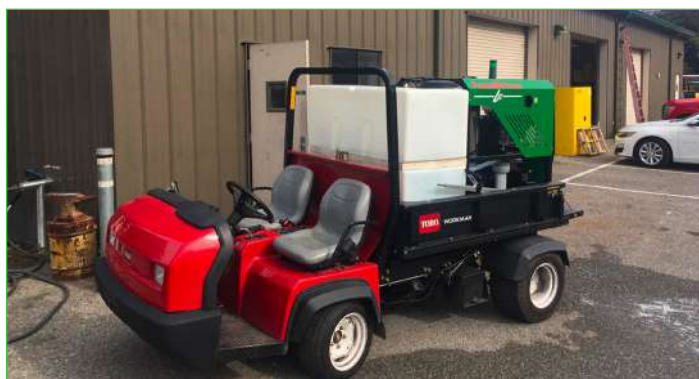
L12 + TORO WORMAN

Foamstream es la mejor tecnología para el control de mala hierba sin herbicidas. Esta espuma biodegradable impide que el calor del agua caliente se escape a la atmósfera, atrapándolo y manteniéndolo directamente sobre la planta durante un periodo de tiempo prolongado. El calor atraviesa la capa exterior cerosa de la hoja y circula por el tallo hasta el interior de las raíces, acabando con la vegetación no deseada de forma rápida y sostenible.