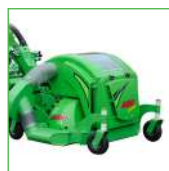
SEGADOR CON RECOGEDOR