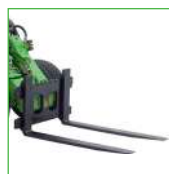
HORQUILLA DE PALÉ