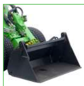
CAZO 4 EN 1