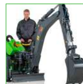
RETROEXCAVADORA 260 CON CONTROL REMOTO