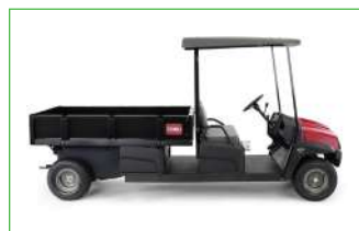
CAJA 1,8 M