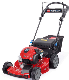
550C REC Full Equip