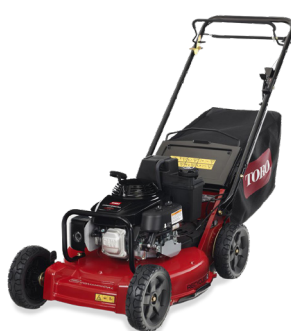
Pro 53 II